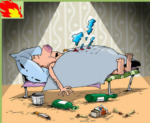
НЕОСТОРОЖНОЕ ОБРАЩЕНИЕ С ОГНЕМ