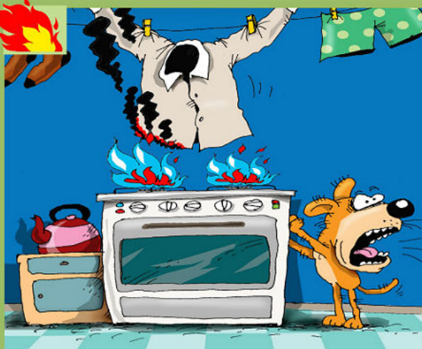
НАРУШЕНИЕ ПРАВИЛ ПОЖАРНОЙ БЕЗОПАСНОСТИ ПРИ ЭКСПЛУАТАЦИИ ГАЗОВОГО И ЭЛЕКТРИЧЕСКОГО ОБОРУДОВАНИЯ