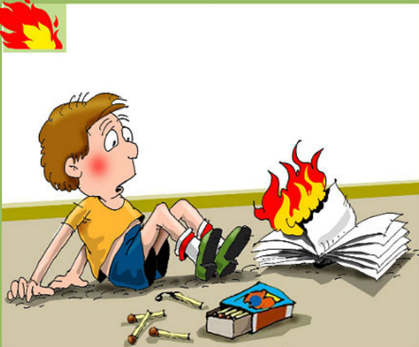
ДЕТСКАЯ ШАЛОСТЬ С ОГНЕМ