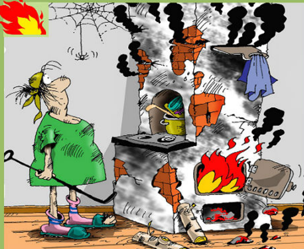
НЕИСПРАВНОСТЬ ПЕЧЕЙ И ИХ НЕПРАВИЛЬНАЯ ЭКСПЛУАТАЦИЯ